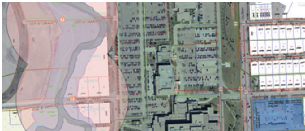
Aktuelle Informationen ermöglichen bessere Analysen. In diesem Beispiel wird eine Gefährdungsanalyse vorgenommen. Grundlage hierfür sind die Regenwasserleitungen, Überlaufbereiche und betroffene Industrieanlagen.

In AutoCAD Map 3D können Projektleiter und Planer GIS- und CAD-Daten überlagern. Auf diese Weise werden die Bestandsdaten in blattschnittfreien Basiskarten erfasst, die eine präzise Vorstellung von der Umsetzung der vorgeschlagenen Entwürfe in der realen Umgebung vermitteln. Mit der in AutoCAD® Map 3D integrierten Software Autodesk® Storm and Sanitary Analysis 2012 führen Anwender hydrodynamische und hydraulische Analysen durch, wie sie für die Planung von städtischen Regenwasser- und Schmutzwassernetzen benötigt werden. Raumbezogene Analysen ermöglichen ein besseres Verständnis der Projektauswirkungen und liefern bereits in frühen Entwurfsphasen die richtigen Informationen für fundiertere Entscheidungen. Eine umfangreiche Bibliothek mit Koordinatensystemen erleichtert die präzise Georeferenzierung ihrer Daten.